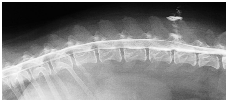
Abbildung 1: Myelogramm zeigt, dass das Kontrastmittel normal durchläuft.

In etwa 80% der Fälle kann ein Spezialist die Läsion auf dem sogenannten Leerröntgen (Röntgen ohne Kontrastmittel) erkennen. Bei vielen Dackeln finden wir jedoch Veränderungen an mehreren verschiedenen Bandscheiben. Es lässt sich nicht ohne weiteres die akute Stelle identifizieren. Mit dem Leerröntgen kann man auch nicht die Seite feststellen, da die meisten Hernien mehr auf eine Seite im Rückenmarkskanal zu liegen kommen. Dies ist für das chirurgische Prozedere von entscheidender Bedeutung.